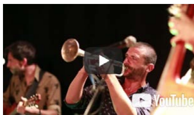
Kote'w Te Ye (Beken) Live @ Le Périscope

Pour vos supports de communication, merci de privilégier les vidéos suivantes: